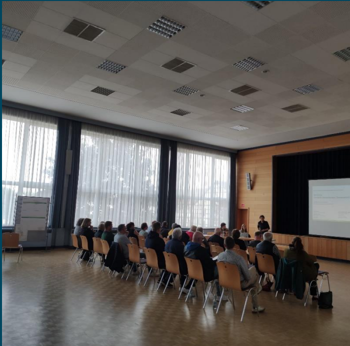
Workshop Arnsbach, Trockenerfurth, Kerstenhausen 09.05.2023 – Gemeinschaftshaus Trockenerfurth