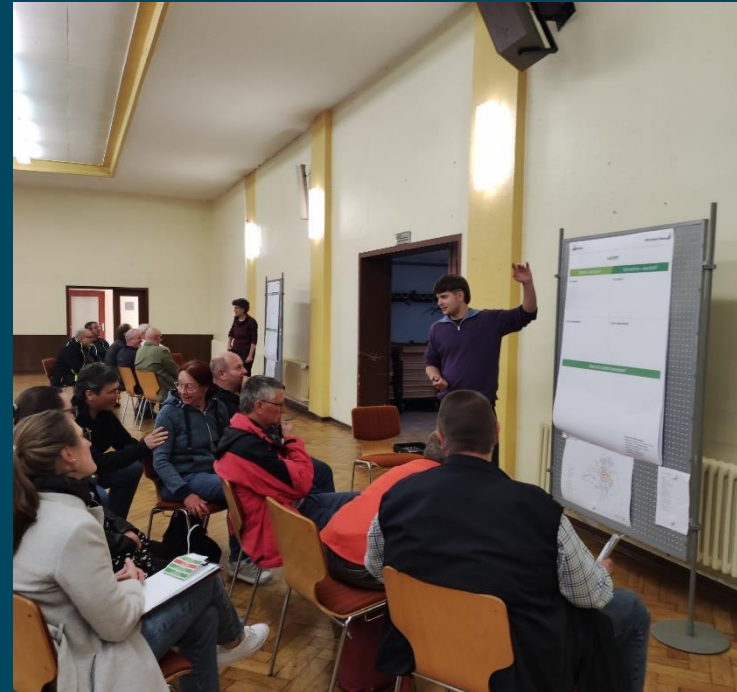
Workshop Gombeth, Singlis, Lendorf, 15.05.2023 Gemeinschaftshaus Gombeth